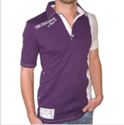
Modèle Club Gstaad

Organisée au Golf de Joyenval, la Vivendi Cup est une nouvelle compétition internationale de golf masculin inscrite au calendrier de l'European Tour. Organisée par Canal+ Events et diffusée sur Canal+, cette compétition est en passe de devenir l'un des événements incontournables du golf français.