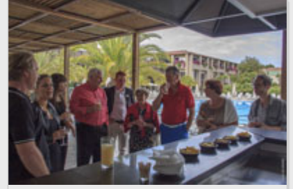
les golfeurs de la semaine

Notre chambre était assez grande avec un lit immense, une petite table, un petit balcon, et de grands rangements. De toutes façons, le but de la semaine étant de jouer au golf et pas de larmuser au lit, cela nous allait très bien. Sur le lit des petits cadeaux : une casquette et une serviette de sac de golf logotés Club Med, une boîte de balles et un exemplaire du dernier numéro du magazine Fairways.