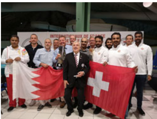
Echange de drapeaux entre l'équipe Suisse et l'équipe du Bahreïn

Cette compétition avait pour but de rassembler les principaux acteurs de la sécurité étatique : police, gendarmerie, sapeur pompier et armée, dans un tournoi sur 54 trous.