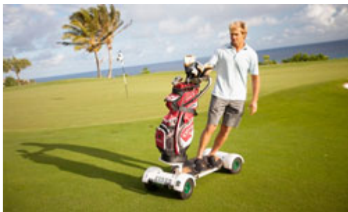
Laird Hamilton, fondateur du Golfboard

Le Golfboard est LE nouveau moyen de déplacement sur un parcours qui va révolutionner le monde du golf. Entièrement électrique et respectueux de l'environnement et du golf – ses pneus sont conçus spécifiquement pour le gazon -, il est composé de quatre roues motrices, et est adapté à tout type de parcours. A mi-chemin entre la patinette et la voiturette, le Golfboard ne vous demandera aucun effort grâce à son moteur à propulsion.